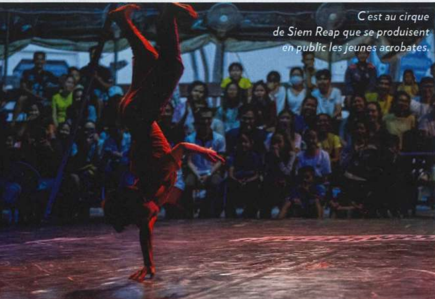
C'est au cirque de Siem Reap que se produisent en public les jeunes acrobates.