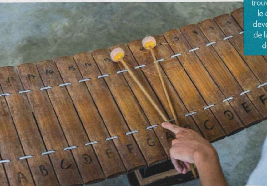
L'enseignement des musiques traditionnelles - ici, un xylophone - bénéficie d'une nouvelle salle de classe.

On se laisse guider vers la nouvelle salle de musique par le doux son du tro, sorte de luth à deux cordes. Ici, on découvre